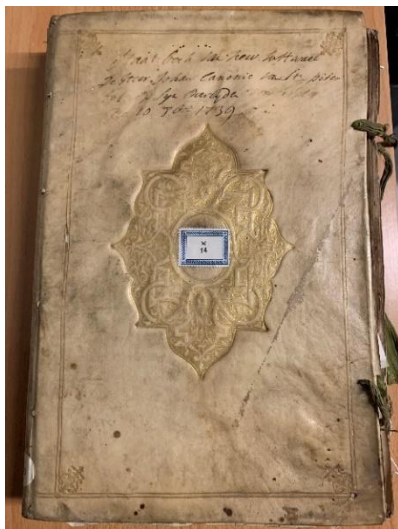
Hs. 7* A 13

Andere archiefstukken rondom de familie Wttewaall en verwanten bevinden zich in Het Utrechts Archief, Toegang 254 (Huis Wickenburg te 't Goy).